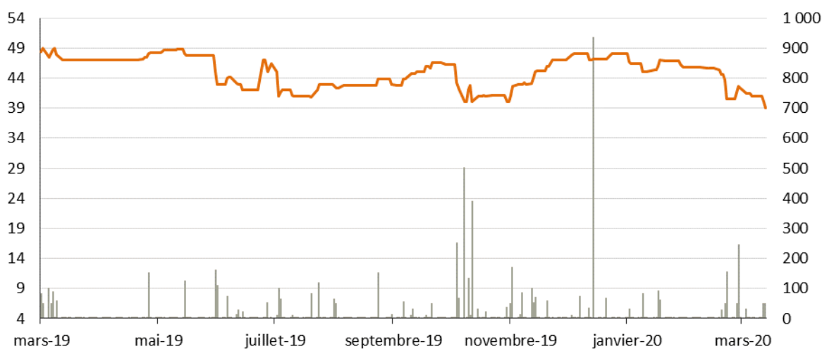
Historique de cours de Bourrelier Group sur 1 an

Au cours des 12 derniers mois étudiés, les volumes se sont élevés à 6 315 titres, soit des volumes quotidiens moyens pondérés de 1061€. Compte tenu d'un flottant de 12,71%, le taux de rotation du flottant de Bourrelier Group atteint 0,8%, un niveau très faible. Il n'empêche que ce dernier constitue toutefois un repère que nous faisons figurer à titre indicatif dans le cadre de l'évaluation de Bourrelier Group.