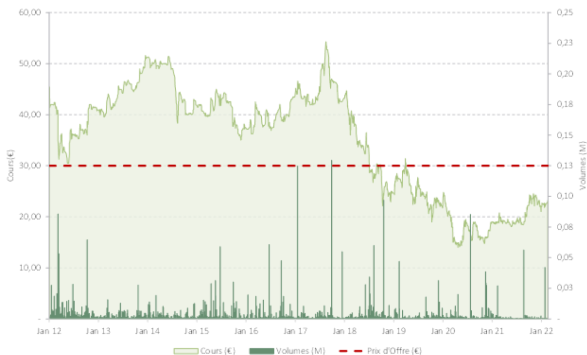
Figure 18 : Evolution du cours de bourse depuis janvier 2012

Le tableau ci-dessous présente les primes induites par le prix de l'Offre sur :